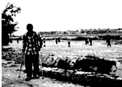
Il calcio, sport nazionale iracheno, sulle rive del Tigri

La nazionale olimpica si qualificò per le Olimpiadi battendo l'Arabia Saudita ad Amman in Giordania. A Baghdad gli americani tentarono di far posare la squadra allo stadio al Shaab con una nuova bandiera irachena proposta dal governo provvisorio, ma i giocatori portarono la vecchia cantando: «Questa è la nostra bandiera, non è di Saddam e ne andiamo fieri». Il governo provvisorio aveva già modificato il progetto originario della nuova bandiera a causa delle proteste per la sua somiglianza con quella di Israele, Paese odiato dagli iracheni.