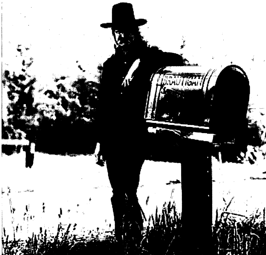
Lo scrittore americano Richard Brautigan nella foto di copertina dell'edizione statunitense del «Mostro degli hawklime»

disse Cameron. «È il maledetto viaggio su quel maledetto barcone per niente. Lo dicevo io che me la vomitavo tutta e ora devo rifarmela e per di più con due spiccioli soltanto in tasca.»