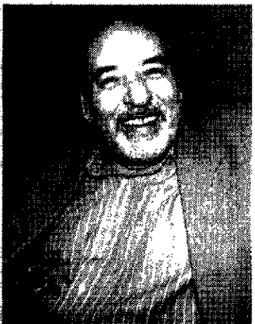
T. BEN JELLOUN Contro il razzismo

genda che vede esaurirsi i campioni a ridursi a pezzi della memoria.