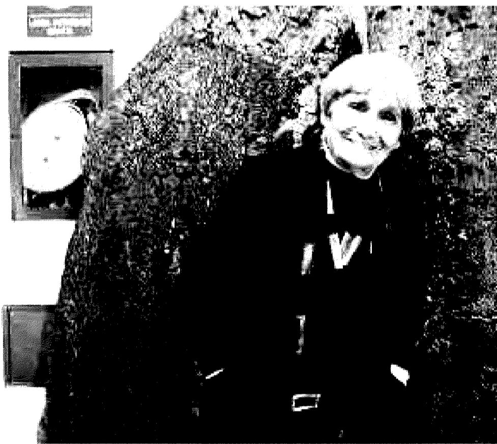
Maria Lai ieri al museo di Aggius in un ritratto di Tatiano Maiore

Un'occasione per rivedere le immagini di «Legarsi alla montagna» grazie a un filmato girato all'epoca. Maria Lai allora viveva a Roma. Il sindaco di Ulassai la cercò per affidarle la costruzione di un monumento