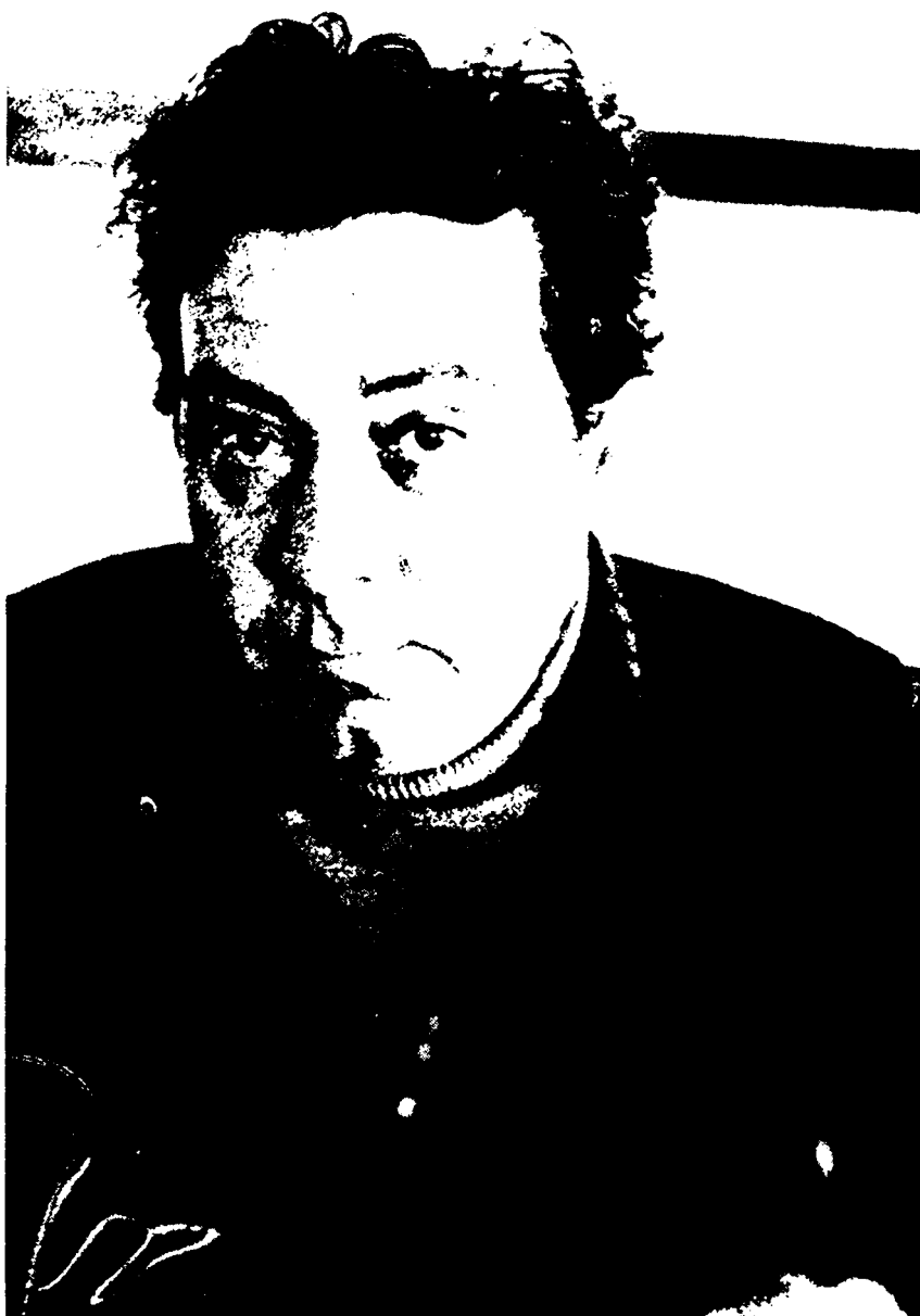
Luciano Bianciardi: il suo romanzo più emblematico è l'autobiografico «La vita agra», 1962