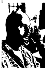
GENERAZIONE IRREGOLARE Nella foto grande, il Beatnik night-club (1960). Sopra, dall'alto, Jack Kerouac e Lawrence Ferlinghetti. Sotto, un ritratto di Richard Brautigan (1981)